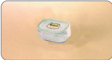
RP 520 / 150 cc (90x60x40mmh)