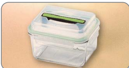
RP 601 / 1800cc (200x150x95mmh)